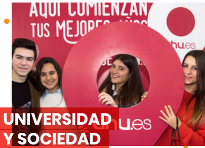
UNIVERSIDAD Y SOCIEDAD