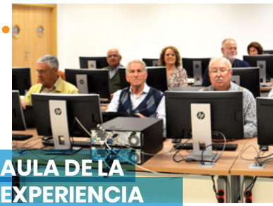
AULA DE LA EXPERIENCIA

En las miradas que aquí se entrecruzan, en el trabajo cotidiano, en el afán sostenido a lo largo de los años está la fuerza que ha hecho posible la creación y el despliegue posterior de la Universidad de Huelva. Gracias a todas y a todos. A quienes aparecen en las fotos y a quienes estuvieron, como suele decirse, al otro lado de la cámara. Esta exposición conmemorativa de los 25 años que ahora cumple la Universidad de Huelva es, por encima de todo, la historia de sus vidas.